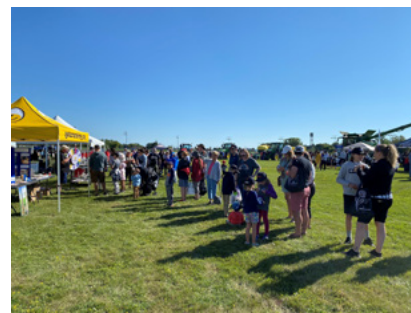
Les participants font la file à l'exhibit de la EFO pour tenter leur chance à la roue de culture générale.