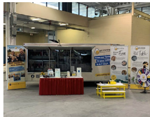
L'exhibit de la EFO à l'Exposition nationale canadienne.

Merci à tous les bénévoles qui rendent possibles des événements comme celui-ci !