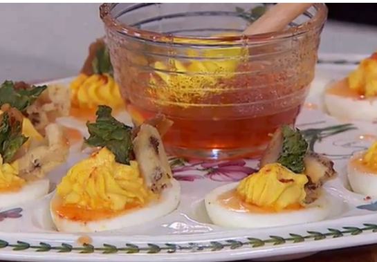
Ci-dessous : La délicieuse recette de Poulet et œufs à la diable sur gaufres.