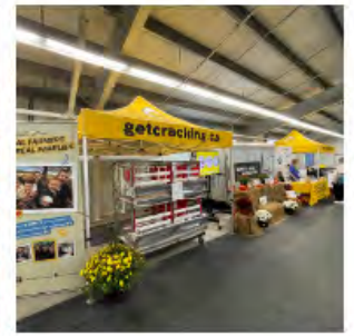
Dans le sens horaire, en commençant en haut à gauche : Déjeuner à la ferme, à Napanee; visiteurs de l'exposition de la EFO à l'ENC; petite remorque de la EFO à la Foire de l'Ouest; et à la Foire de West Niagara.