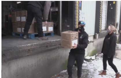
Ci-dessus : Capture d'écran montrant les œufs chargés pour livraison à l'Armée du Salut.