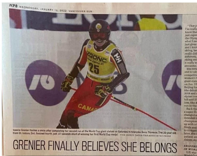
Ci-dessus : Les réalisations de Valérie ont été présentées dans le Vancouver Sun.