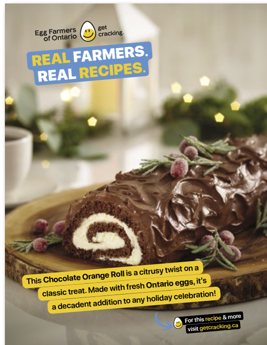
Ci-dessus : Annonce du Gâteau roulé au chocolat et à l'orange de la EFO dans le numéro des fêtes du magazine Food & Drink de la LCBO.