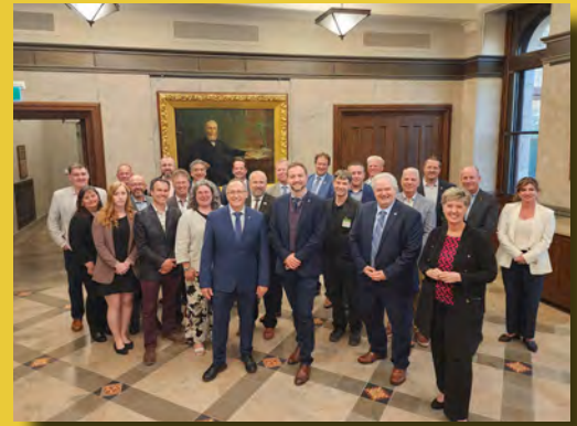
Ci-dessus : La ministre Bibeau après une conférence de presse avec le député Thériault et des représentants gouvernementaux et agricoles le 21 juin 2023.

Pour regarder toute la conférence de presse, cliquez ici .