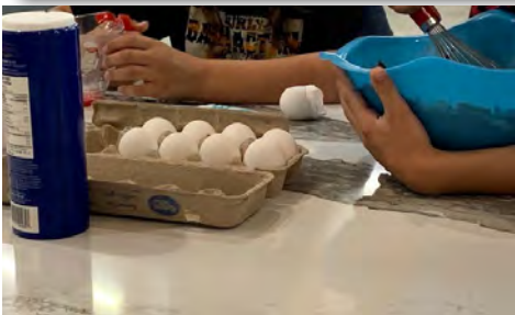
Ci-dessus (à partir du haut) : Une affiche avec des messages positifs accueille les jeunes qui arrivent sur le site; des œuvres d'arts colorées créées par des jeunes sont fièrement exposées à travers le site; dans la cuisine, une plaque montre l'engagement de la EFO; et un groupe démontre ses compétences en cuisine durant une activité pâtisseries.